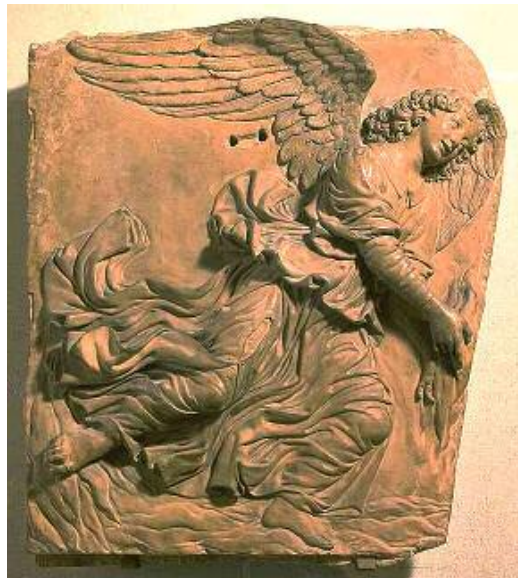
فیریکۆ Andreadel Verrocchio